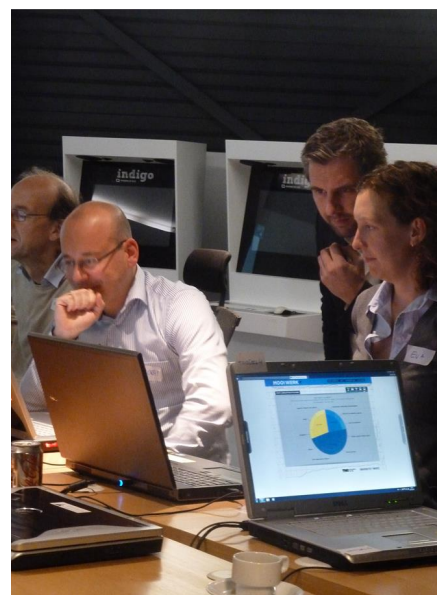
Begeleiding door Mooi Werk Trainer

Er is ook de mogelijkheid om in uw eigen organisatie trainers op te leiden tot Mooi Werk Trainer in een train-de-trainer traject van 3 dagdelen.