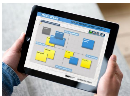
UNIEK: Digitale job crafting applicatie

Werk verandert voortdurend. Werknemers ook. Behoeftes, sterktes en (bv. fysieke) capaciteiten veranderen met de jaren. Een duurzame fit tussen werk en werknemer is belangrijk voor de inzetbaarheid. Met behulp van Mooi Werk Tool 'sleutelt' men zelf aan een optimale baanmatch om het werk uitdagend, betekenisvol en gezond te houden. Met deze in de praktijk geteste digitale job crafting applicatie worden medewerkers in teamverband actief betrokken bij het bevorderen van hun duurzame inzetbaarheid. Taakdata die wordt verzameld biedt tevens kansen voor verdere analyses.